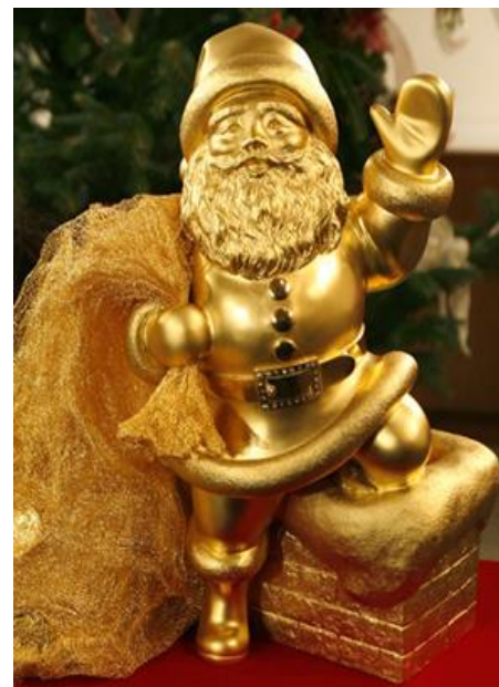
Die begehrte Trophäe: Der Goldene SANTA