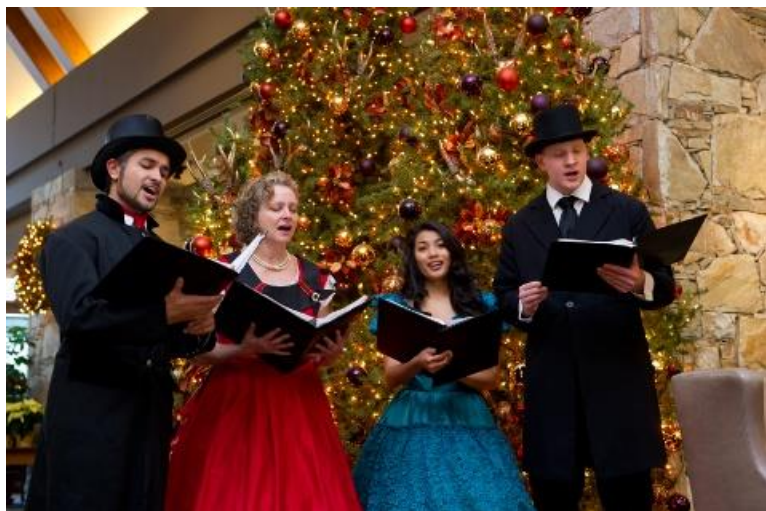
Tradition in den USA: Carol Singers; vielerorts wird der Brauch des nachbarschaftlichen Singens zur Weihnachtszeit lebendig gehalten

Jingle bells, jingle bells, Jingle all the way. Oh! what fun it is to ride In a one-horse open sleigh. Jingle bells, jingle bells, Jingle all the way; Oh! what fun it is to ride In a one-horse open sleigh.